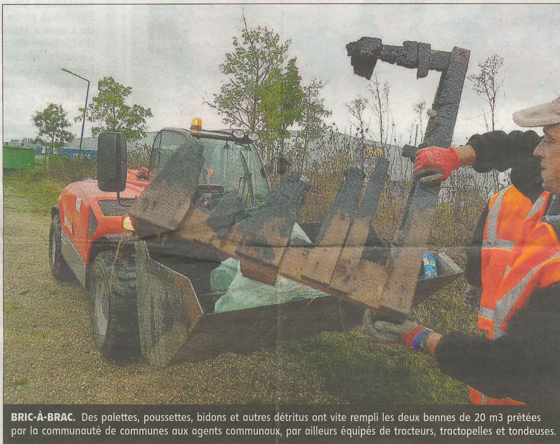
BRIC-À-BRAC. Des palettes, poussettes, bidons et autres débris ont vite rempli les deux bennes de 20 m 3 prêtées par la communauté de communes aux agents communaux, par ailleurs équipés de tracteurs, tractopelles et tondeuses.

Les pouvoirs publics en question sont tout de même cons-